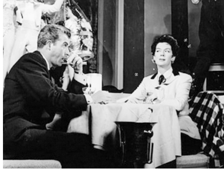
1955 L'HÉRITIÈRE DE LAS VEGAS (The Girl Rush) de Robert Pirosh avec Rosalind Russell