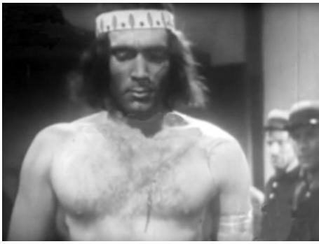
1942 FRONTIÈRE SUD (Frontera sur) de Belisario Garcia Villar