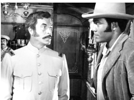
1968 LES CENT FUSILS (100 Rifles) de Tom Gries avec Jim Brown