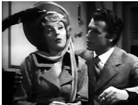
1949 L'HISTOIRE DU TANGO (La Historia del Tango) de Manuel Romero avec Virginia Luque