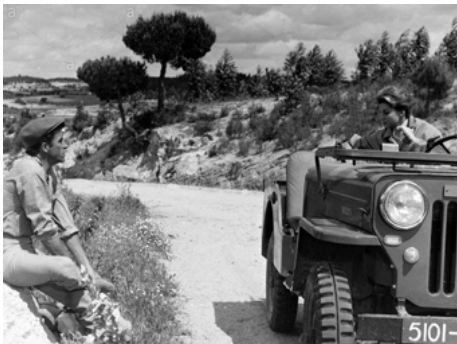
1961 LA FONTAINE MAGIQUE (La Fuente magica) de Fernando Lamas avec Esther Williams