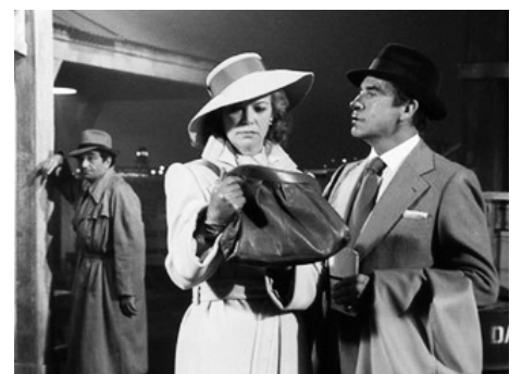
1978 LE PRIVÉ DE CES DAMES (The Cheap Detective) de Robert Moore avec Peter Falk, Louise Fletcher