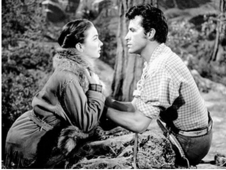
1954 ROSE-MARIE (Rose-Marie) de Mervyn Le Roy avec Ann Blyth