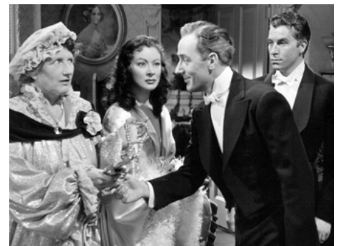
1951 L'AMANT DE LADY LOVERLEY (The Law and the Lady) d'Edwin H. Knopf avec Greer Garson, M. Wilding