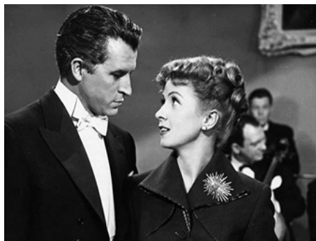
1951 RICHE, JEUNE ET JOLIE (Rich, young and pretty) de Norman Taurog avec Danielle Darrieux