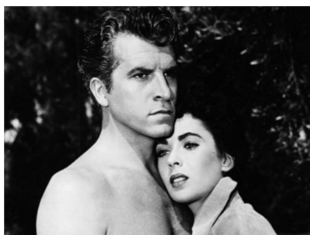
1952 LA FILLE QUI AVAIT TOUT (The Girl who had everything) de Richard Thorpe avec Elizabeth Taylor