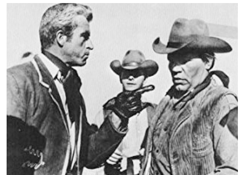
1968 BACKTRACK ! (Backtrack !) d'Earl Bellamy avec Doug McClure, James Drury