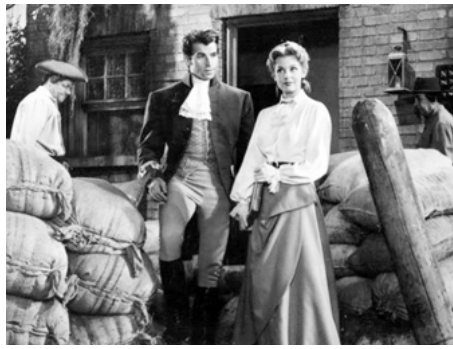
1953 SANGAREE (Sangaree) d'Edward Ludwig avec Arlene Dahl