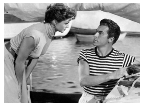
1952 TRAVERSONS LA MANCHE (Dangerous when wet) de Charles Walters avec Esther Williams