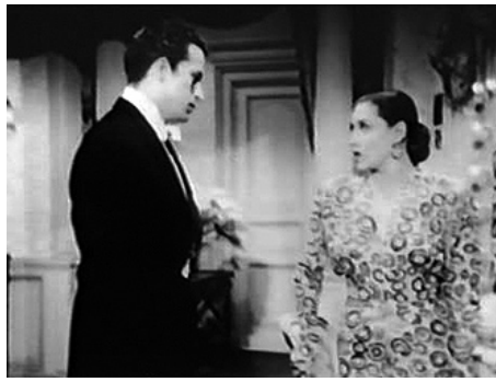
1947 EL TANGO VUELE A PARIS de Manuel Romero avec Elvira Rios