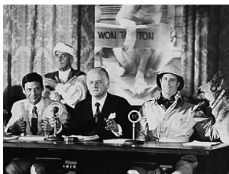
1975 WON TON TON LE CHIEN QUI SAUVA HOLLYWOOD de Michael Winner avec Aldo Ray