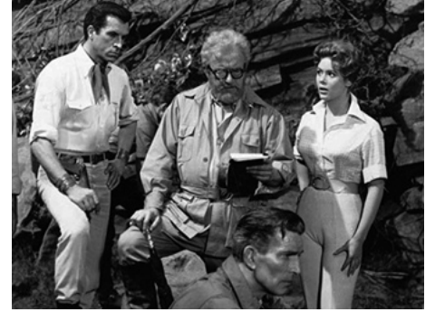
1960 LE MONDE PERDU (The lost World) d'Irwin Allen avec Claude Rains, Jill St. John, Michael Rennie