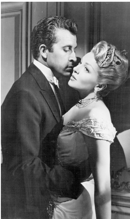
1952 LA VEUVE JOYEUSE (The merry Widow) de Curtis Bernhardt avec Lana Turner