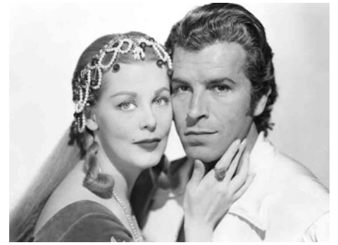
1954 LE DIAMANT BLEU (The Diamond Queen) de John Brahm avec Arlene Dahl