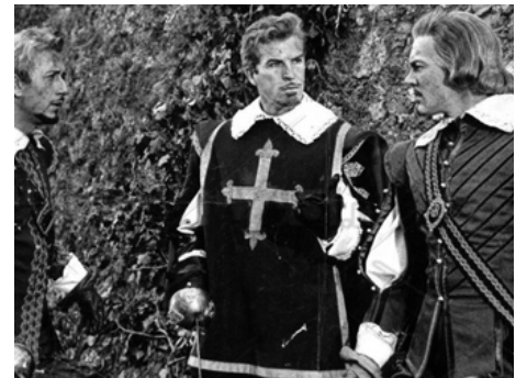
1963 LA REVANCHE DE D'ARTAGNAN (D'Artagnan contro i tre moschetteri) de Fulvio Tului avec R. Rizzo