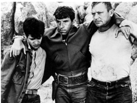
1966 LES VIOLENTS (The Violent Ones) de Fernando Lamas avec Tony Sands, Aldo Ray